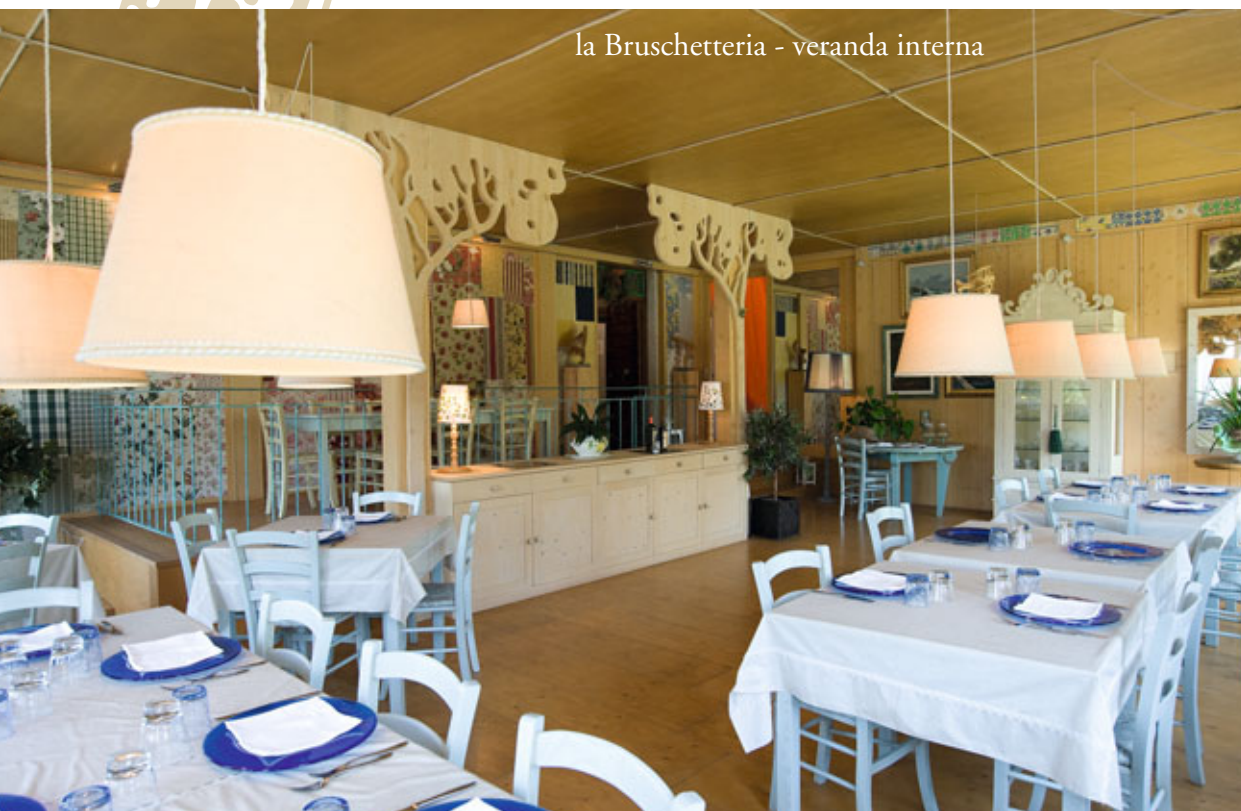
la Bruschetteria - veranda interna