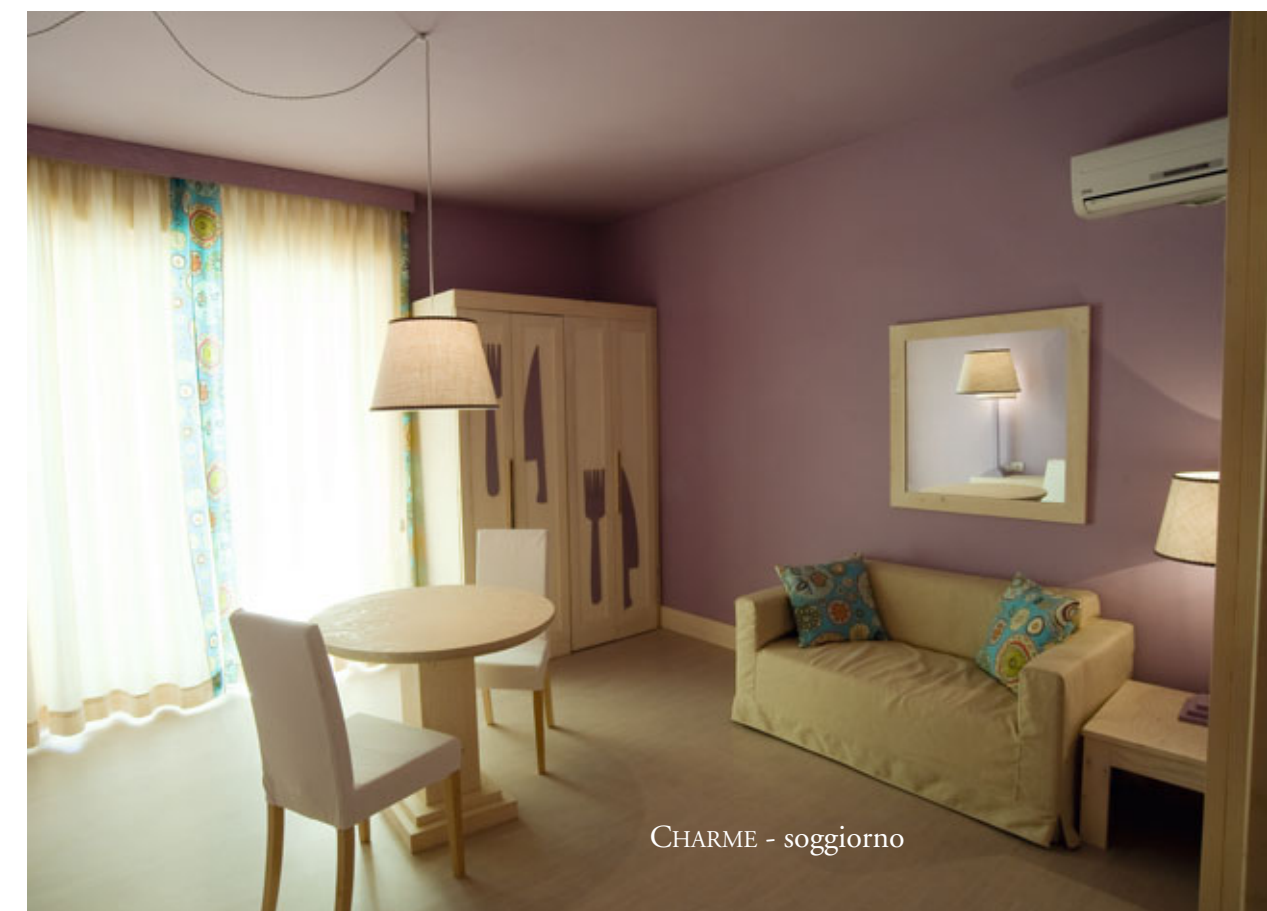
CHARME - soggiorno

Ultima Spiaggia, Il Chiarone, Ansedonia.