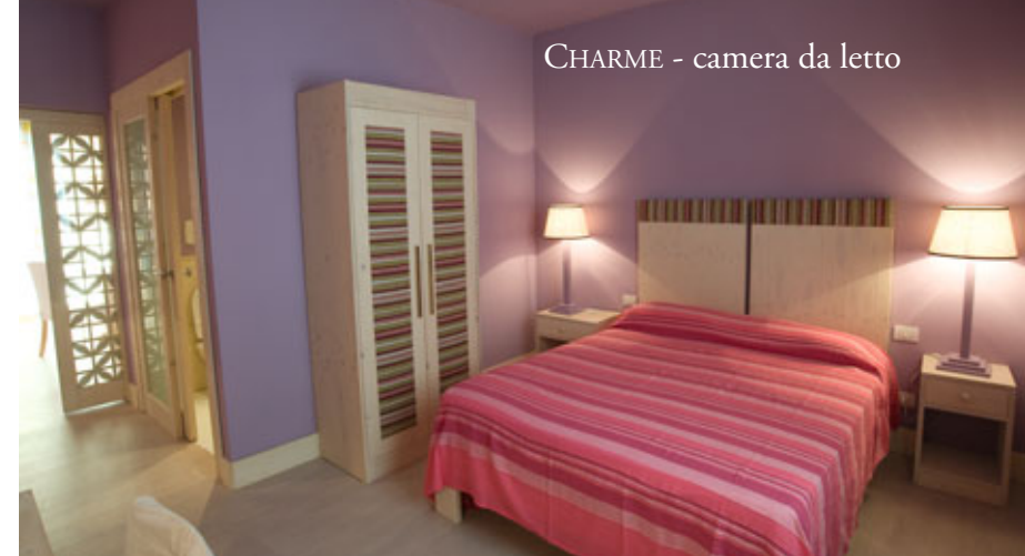
CHARME - camera da letto

Ubicata all'interno del complesso aziendale del Frantoio, a soli cinquecento metri dal centro di CANINO, immersi tra i boschi di olivi secolari da cui si ottiene il famoso Olio Extra Vergine d'Oliva DOP Canino.