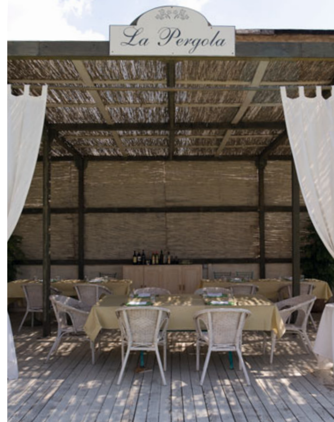
la Bruschetteria - LA PERGOLA veranda esterna

L'origine del paese è legato alla potente famiglia "Gens Canina" proveniente dalla vicina città Etrusca di Vulci, successivamente assoggettata al potere romano.