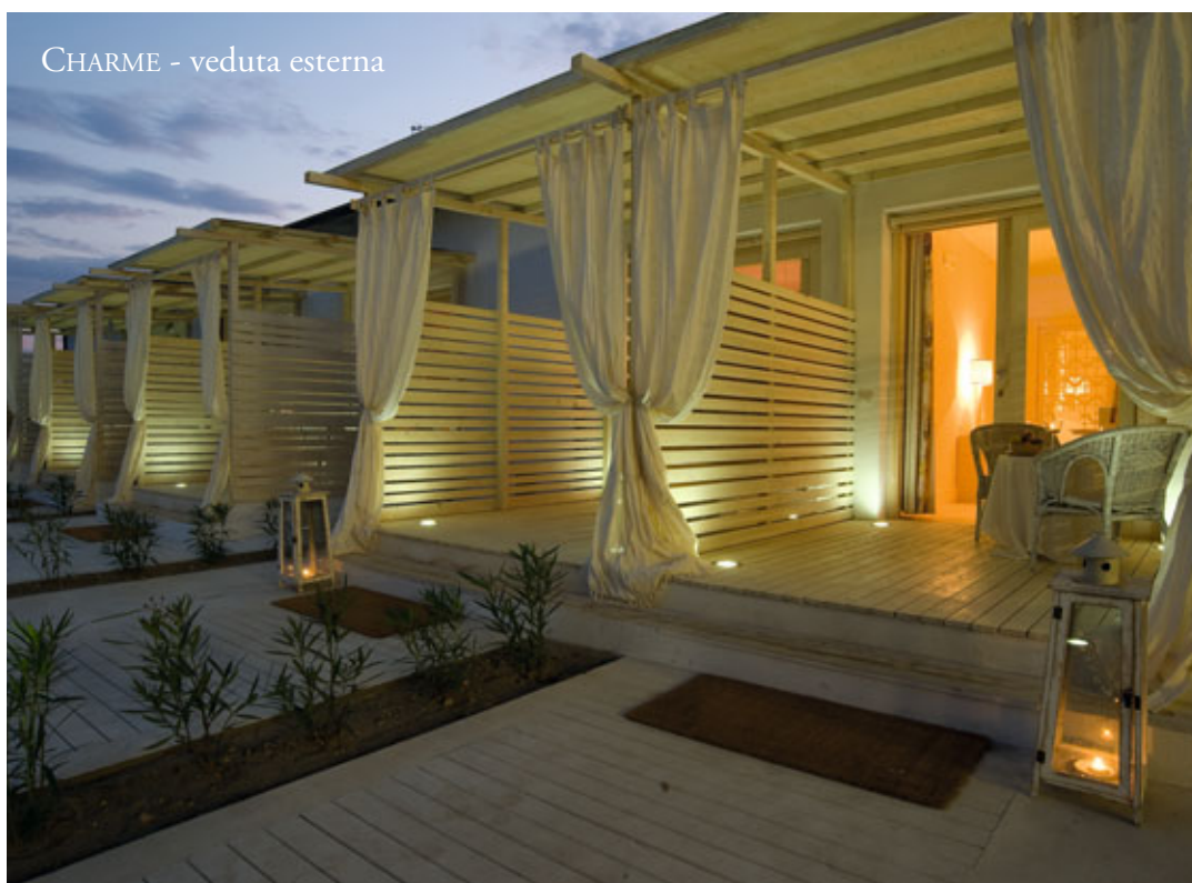
CHARME - veduta esterna

È merito dello stesso Principe Luciano BONAPARTE la prosecuzione della bonifica del territorio avviato dallo Stato Pontificio all'inizio dell'800 e la coltivazione intensiva dell'Olivio nelle campagne: progetti