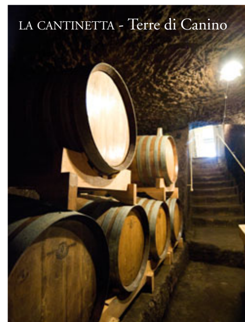
LA CANTINETTA - Terre di Canino

completati a metà del '900 con la grande riforma Fondiaria promossa dall'Ente Maremma che hanno gettato così le basi per l'attuale produzione di oltre 100.000 (Centomila) quintali di Olive da cui si ottengono circa 15.000 (Quindicimila) quintali di Olio Extra Vergine di Oliva di cui gran parte a Denominazione di Origine Protetta DOP CANINO, il massimo riconoscimento alla qualità che un prodotto agroalimentare ed il suo territorio, con la propria tradizione e cultura, possono ricevere in ambito comunitario.