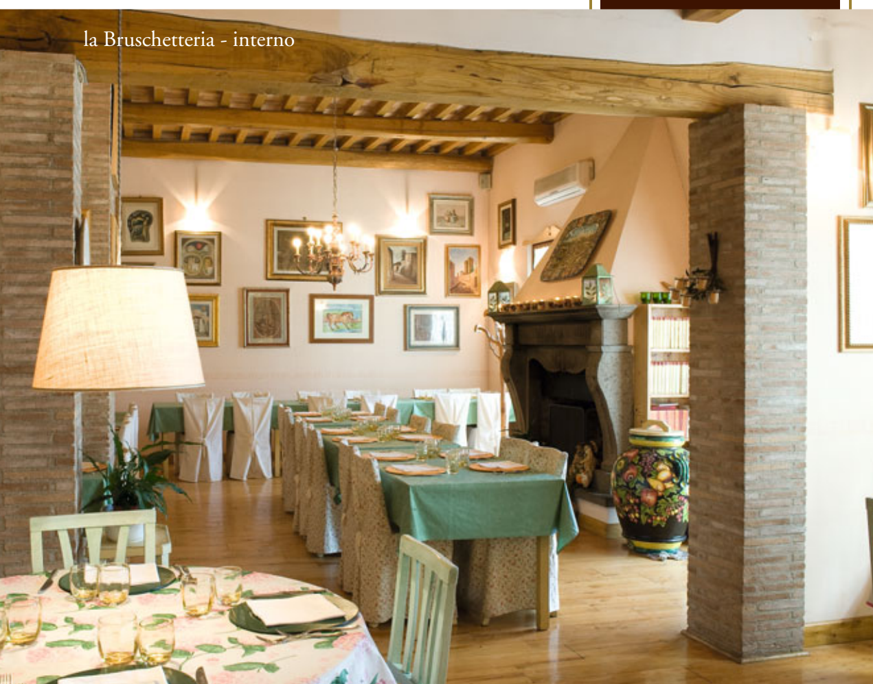
la Bruschetteria - interno